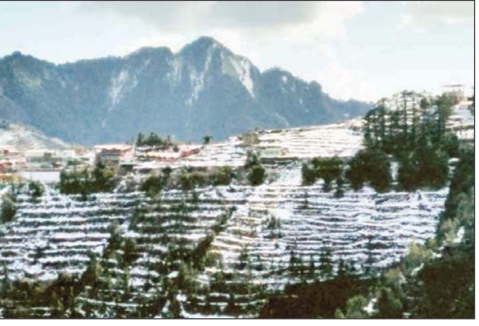
पहाड़ के बागों में जमी बर्फ।