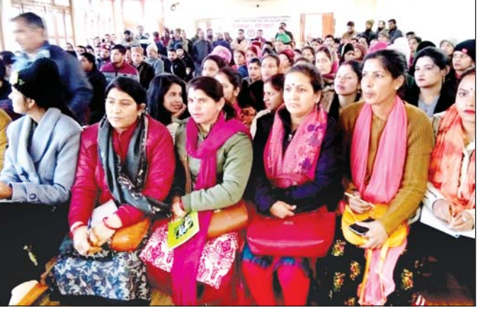
बीडीसी की बैठक में उपस्थित जनप्रतिनिधि।

बीडीसी की बैठक ब्लाक प्रमुख निधि राणा की अध्यक्षता में कैंट इंटर कालेज चकराता में संपन्न हुई। बैठक में बिजली, पानी, सड़क शिक्षा के मुद्दे छाए रहे। बैठक में ब्लाक प्रमुख ने कहा कि अधिकारी जनप्रतिनिधियों के द्वारा उठाई जाने वाली समस्याओं को गर्भीरता से ले और समस्याओं के निस्तारण को लेकर आवश्यक कार्रवाई करें। मुख्य विकास अधिकारी जीएस रावत ने विभागीय अधिकारियों से कहा कि वह सरकार द्वारा संचालित योजनाओं की जानकारी ग्रामीणों को दे, ताकि अधिक से अधिक ग्रामीण सरकारी योजनाओं से लाभान्वित हो सकें। बैठक में पीएमजीएसवाई के अधिकारियों के न पहुंचने पर सदन में मौजूद जनप्रतिनिधियों ने नाराजगी व्यक्त की। जन