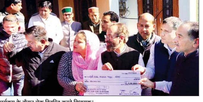
कार्यक्रम के दौरान चेक वितरित करते विधायक।